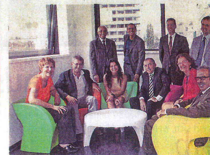
Die fröhlichen Farben der Stühle wirkten offenbar auf die Stimmung.