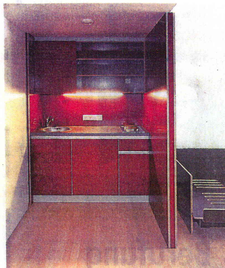
Kochen kein Problem. Jedes Zimmer verfügt über eine funktionale Küche und eine eigene Nasszelle.