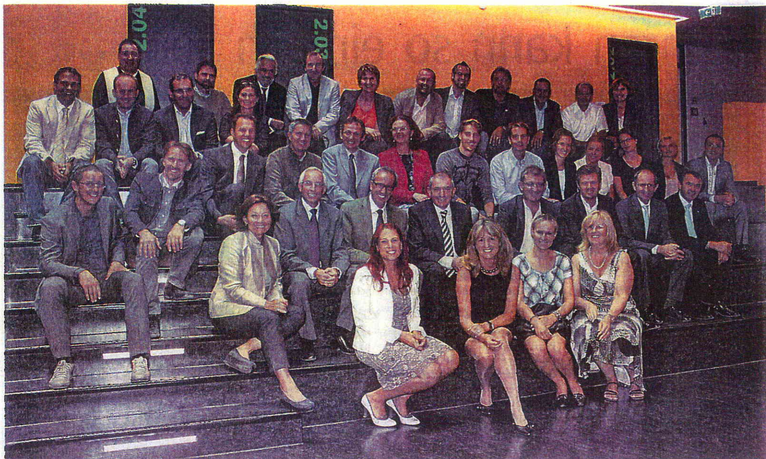
Die Ehrengäste und Projektverantwortlichen überzeugten sich mit Begeisterung gleich selbst von der Funktionalität der „Kommunikations-Stiege“. Fazit: besonders wertvoll.